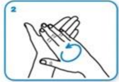
Трљати руке дланом о длан