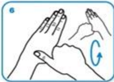
Шаком обухватити палац друге руке и трљати га кружним покретима