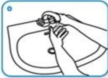
Наквасити руке водом