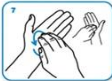
Прсте скупити на длан друге шаке и трљати кружним покретима