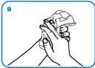
Осушити руке папирним убрусом...