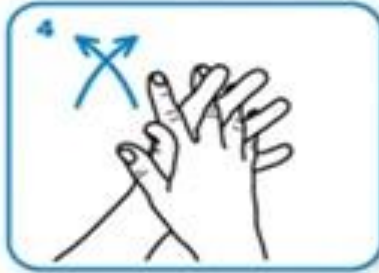
Испреплићући прсте, трљати дланове један о други