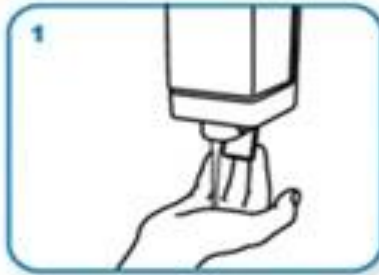
Узети довољну количину течног сапуна да покрије све површине дланова